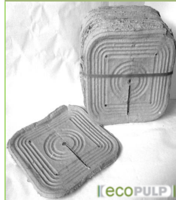
Tuotteen halkaisija n. 400mm, paino n. 100 g

Ecopulp Taimitassu hengittää, vilkastuttaa pieneliötoimintaa sekä tasaa kosteusvaihteluita. Materiaali ja rakenne antavat myöten puun rungon kasvaessa eikä suoja hierrä kuorta rikki. Ecopulp Taimitassu on helppo asentaa myös jo istutettuihin taimiin kyljessä olevan viillon ansiosta